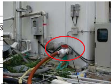
平成23年7月29日