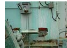
平成23年9月26日