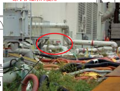
平成23年9月26日