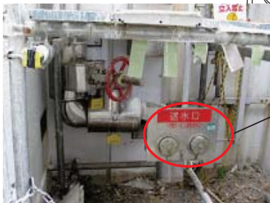
平成23年8月1日