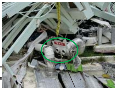
平成23年8月1日