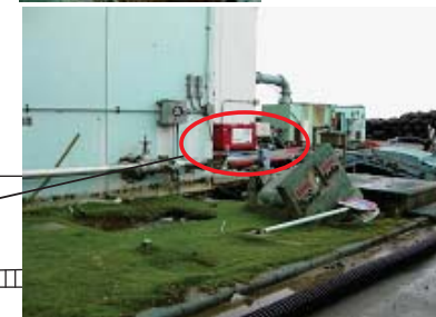
平成23年7月29日